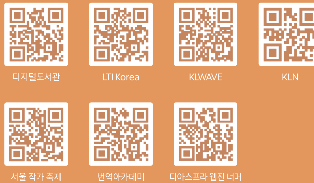
디지털도서관 LTI Korea KLWAVE KLN 서울 작가 축제 번역아카데미 디아스포라 웹진 너머